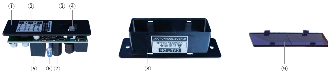
①底盖 ②接线标贴 ③距离调节可调开关 ④接线插座 ⑤接收仓 ⑥指示灯(红、蓝) ⑦发射仓 ⑧上盖 ⑨滤光镜